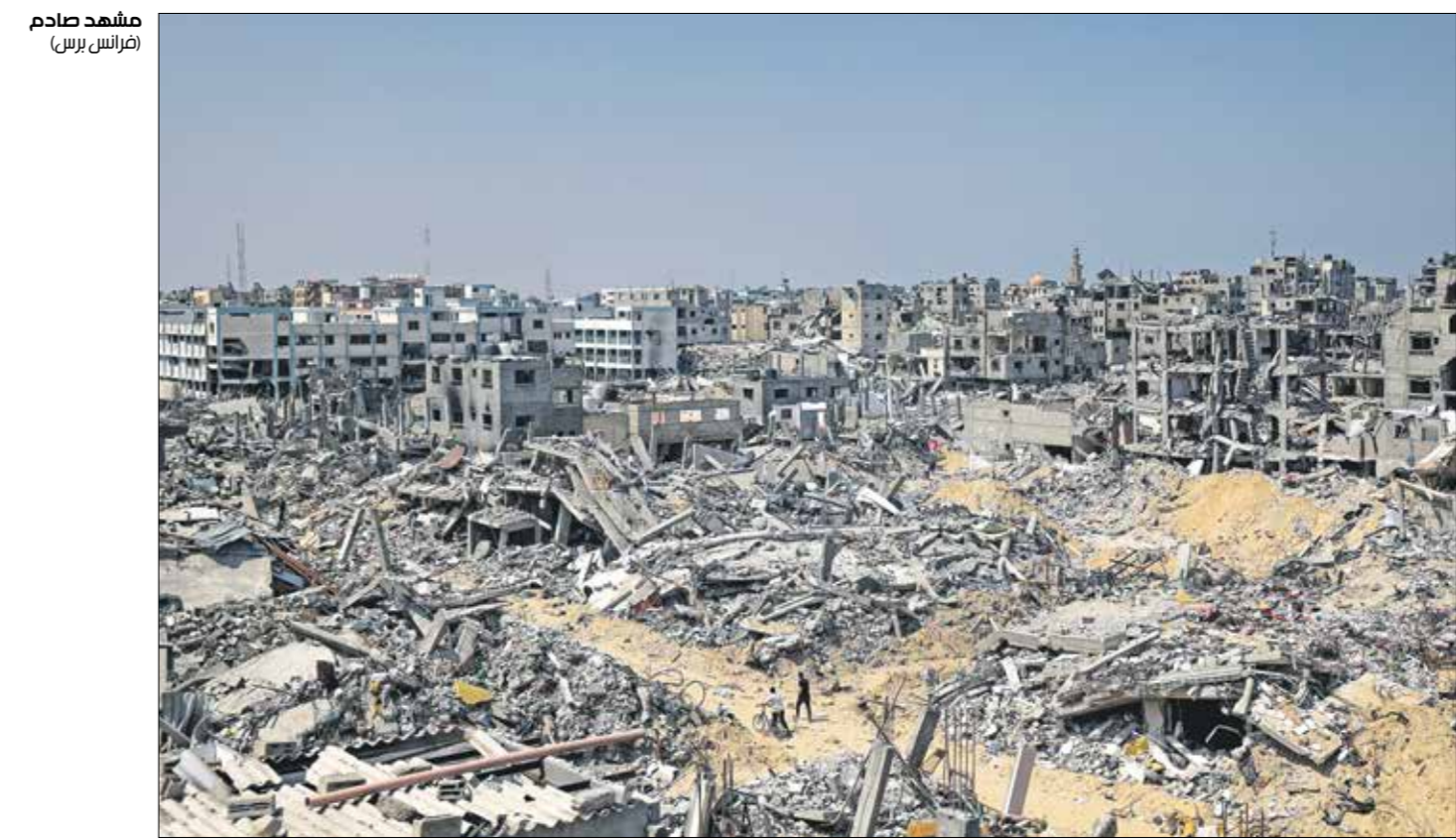
مجدد ملاحم لعمان واحياء