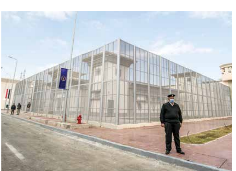
سجن بدر، شرق القاهرة، يناير 2022