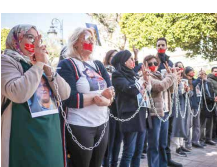
حاكم لظاهرة للملاحة، بإطراف سراج المعتقلين السياسيين، تونس، فبراير الماضي