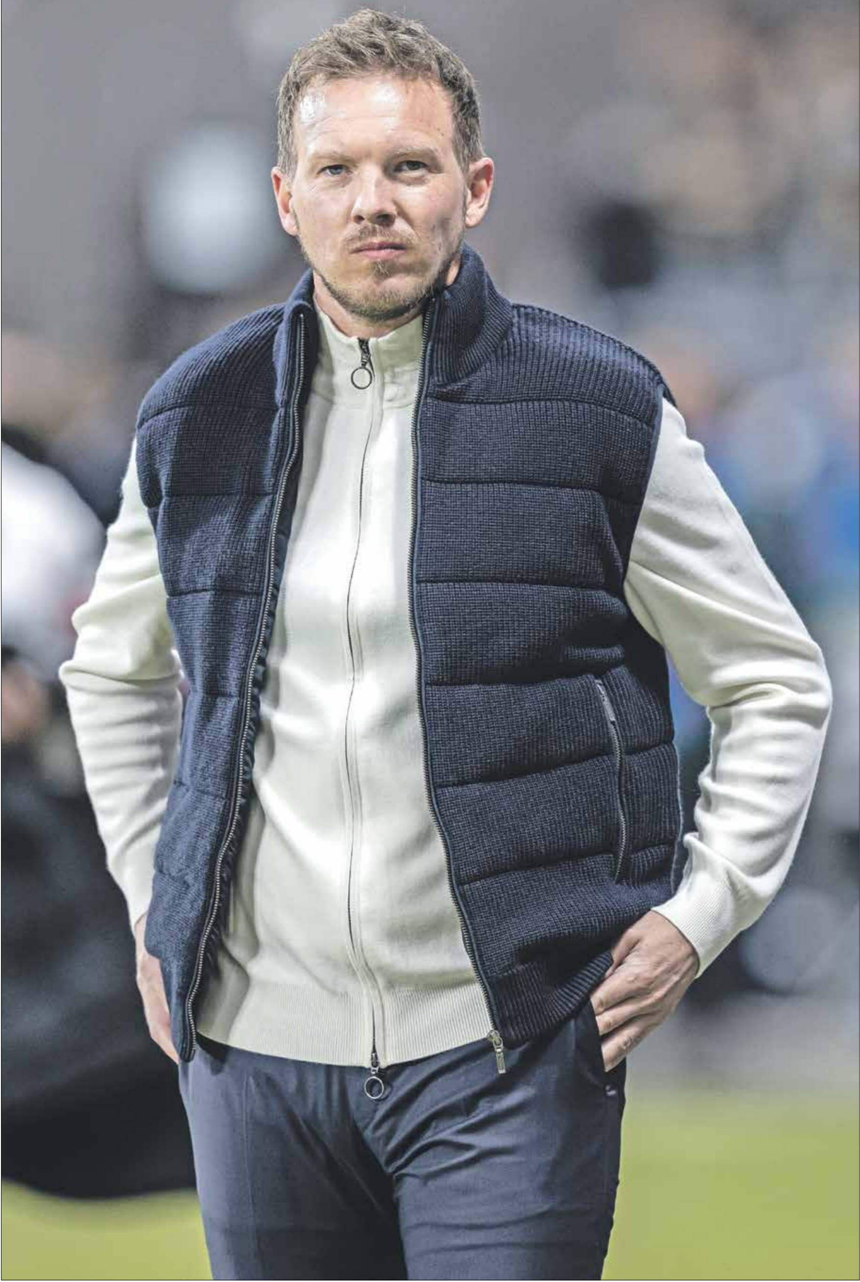
يوسف ناغلسمان للترويج بلبق بجره 2024، مع منتخب ألمانيا