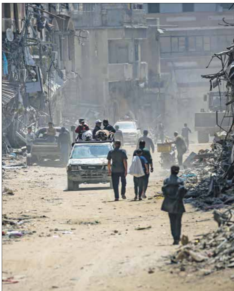
مجدد ملاحم لعمان واحياء