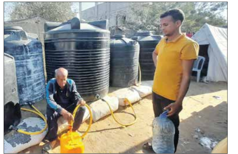
يبحث في تعبئة مياه الشرب المظلمة