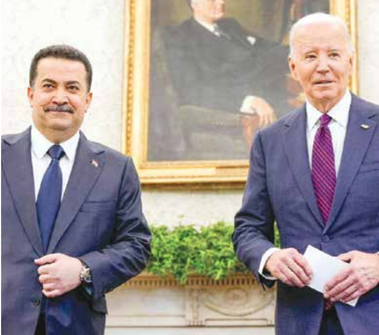
بائد والسوداني في البيت الأبيض، 15 إبريله الحالي