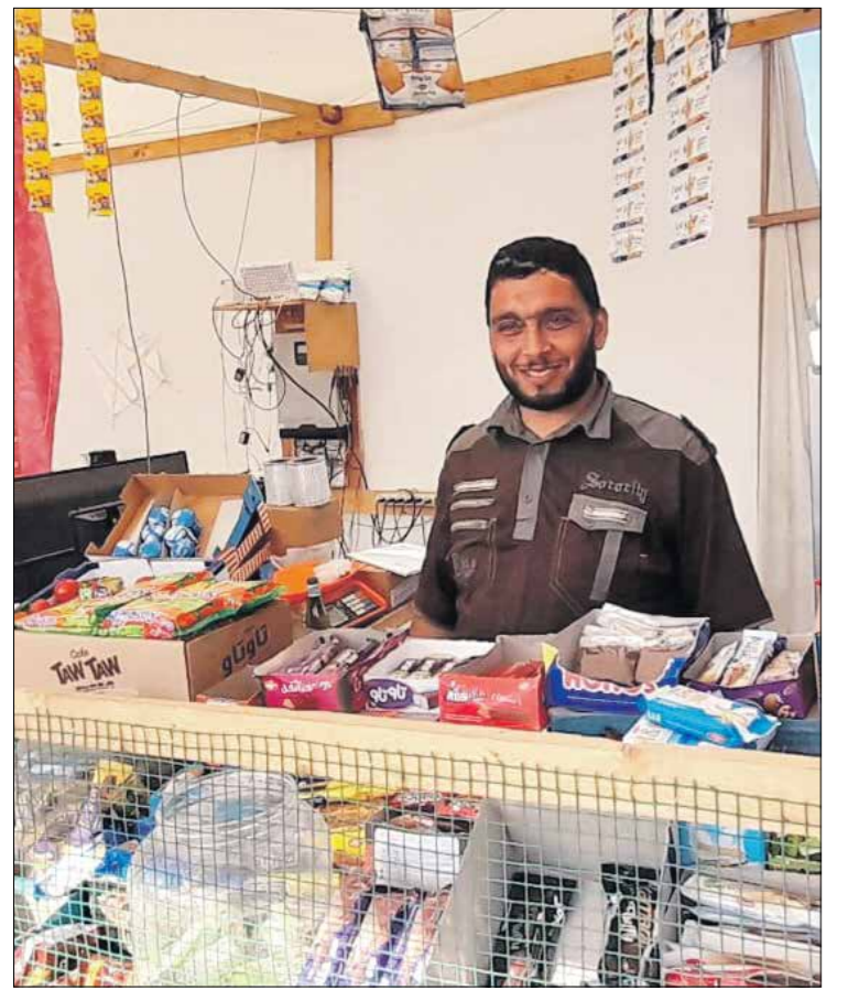
بسطة بيع حلويات وخبزات