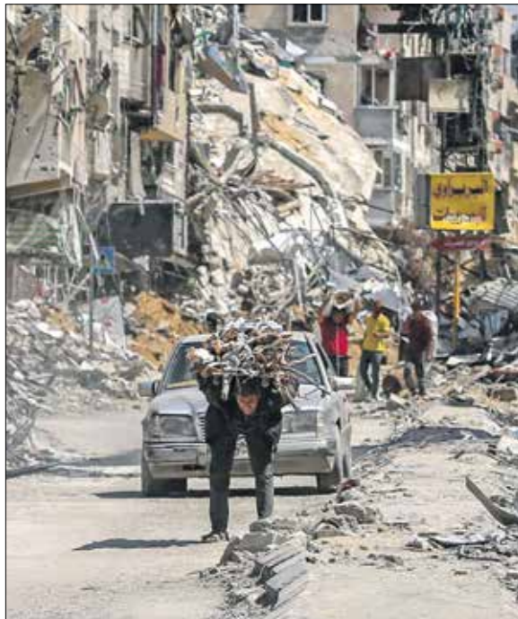
مجدد ملاحم لعمان واحياء

سنوات معناه وجهه وسؤت الممتلكات بالأرض حتى إن بعضها بات بلا أثر. لم تترك استراتيجيا الأرض المحروقة الإسرائيلية أي شيء في خان يونس، لذا قال بعض العائدين أنهم سيكررون النزوح إلى رفح أو ربما إلى مناطق قريبة أخرى. في أي مكان ينتقل إليه فلسطينيو غزة اليوم لا تلقى أعينهم إلا مشاهد انعدام الأمل، مدنهم ومناطقهم التي صمدوا فيها سنوات طويلة أشدها خلال الحصار الإسرائيلي مطلع عام 2006، انهارت كنتيجة واضحة لأهداف الحرب الإسرائيلية الأبعد بالتأكيد من محاربة