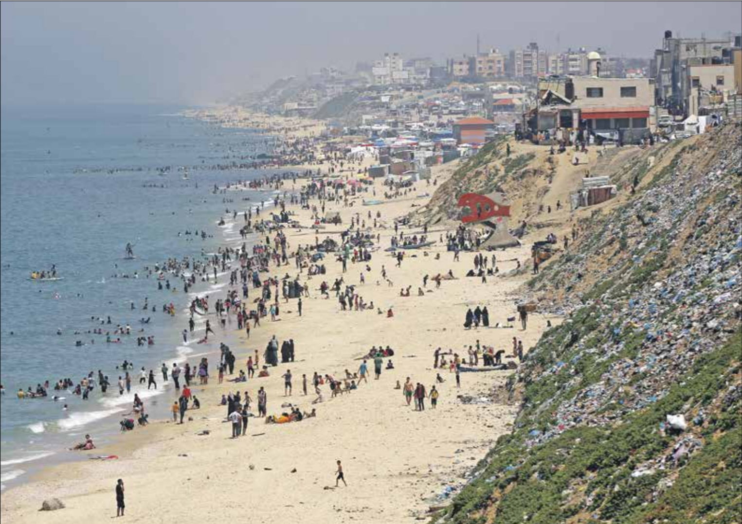
على شاطئ دبر البلد 17 أبريل 2024

ونشر موقع ذا نيو اراب (النسخة الإنكليزية من «العربي الجديد») جزءاً من مضمون الرسالة، وفيها: «صحافيون فلسطينيون، نشاتدكم بشكل عاجل، زملاتنا على مستوى العالم، المطالبة بانحلال إغرائات فورية وثابتة ضد نواطؤ إدارة بايدن المستدر في المذبحة المنجحة واضطهاد الصحافيين في غزة»، وتضمني الرسالة في وصف الظروف القاسية لعمل كصحافي في قطاع غزة، مقارنة مع عشاء