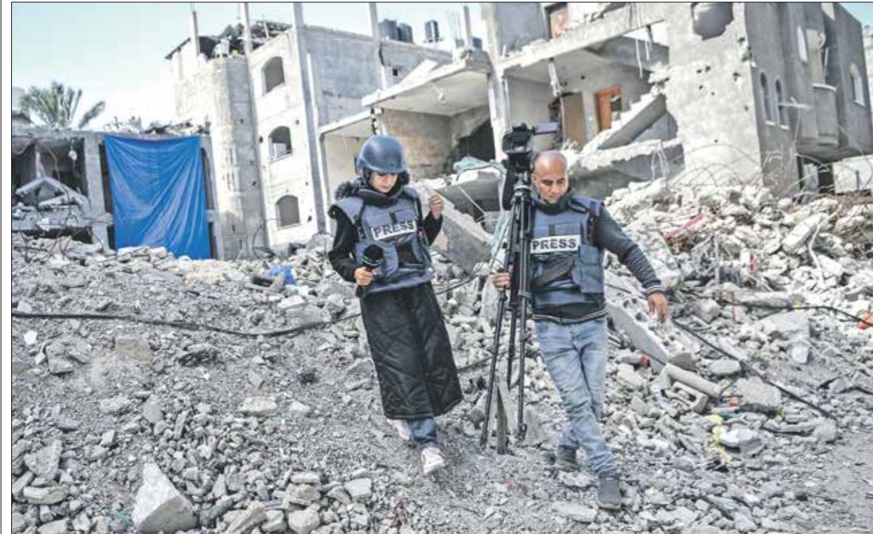
حذر جيش الاحتلال 80 مترا لمؤسسات إعلامية محلية ودولية

لهذا، لن يصدق أحد أن هؤلاء الذين يعضون وقتاً على شاطئ البحر هم أنفسهم من فقدوا بالأسر بيوتاً بنتها الذكريات، وهم من فقدوا عائلات وأصدقاء، وحتى أعضاء من أجسادهم. هؤلاء الذين يعضون إلى البحر، ملائزم الوحيد، كي ينسوا سنة أروية ضيقة من هذا العالم... كي ينسوا سنة أشهر من الإبادة، كي يعضوا مع الشمس في مغيبها، ويعودوا في الصباح