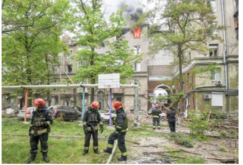
من الصفا الروسيه لتحريربولنوفسك، امن «نيكولا سيبيلنيكوف»(ويتر)

التي فاز فيها بمواجهة المرشحة الديمقراطية هيلاري كلينتون. ولطالما نفى ترامب هذه العلاقة، مؤكداً أن المدفوعات كانت لشان خاص. غير أن المدعي العام في القضية الفين براغ باشر مساراً قضائياً لإثبات أن المبلغ المدفوع لدانييلز كان متاوردة