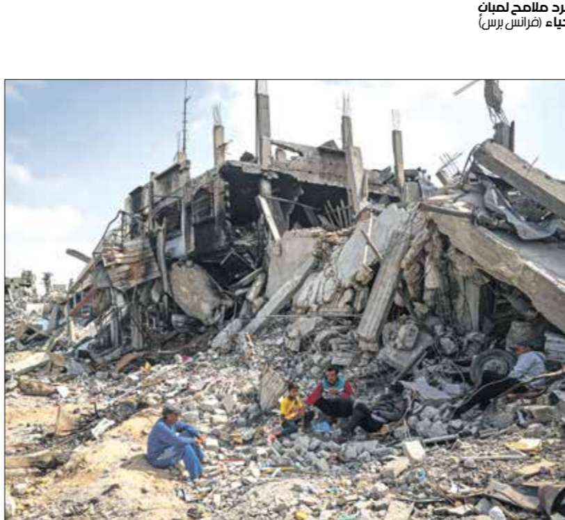
مجدد ملاحم لعمان واحياء (فرايس برس)

سنوات معناه وجهه وسؤت الممتلكات بالأرض حتى إن بعضها بات بلا أثر. لم تترك استراتيجيا الأرض المحروقة الإسرائيلية أي شيء في خان يونس، لذا قال بعض العائدين أنهم سيكررون النزوح إلى رفح أو ربما إلى مناطق قريبة أخرى. في أي مكان ينتقل إليه فلسطينيو غزة اليوم لا تلقى أعينهم إلا مشاهد انعدام الأمل، مدنهم ومناطقهم التي صمدوا فيها سنوات طويلة أشدها خلال الحصار الإسرائيلي مطلع عام 2006، انهارت كنتيجة واضحة لأهداف الحرب الإسرائيلية الأبعد بالتأكيد من محاربة