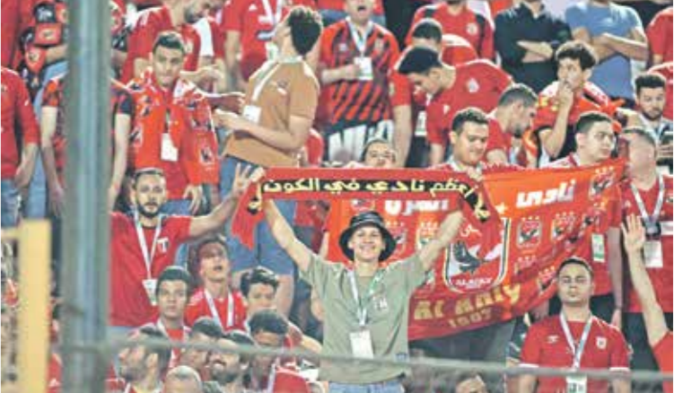
تامل جماهير الاهلي في وصول فريقها إلى النهائي