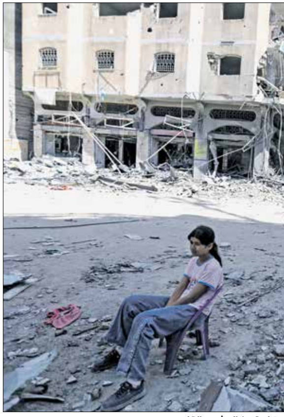
مجدد ملاحم لعمان واحياء