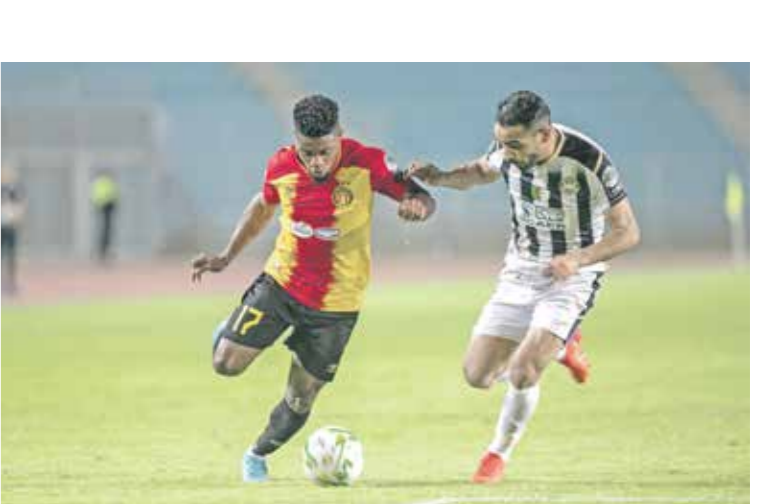
يريد الترجي لتأدي المصاحبات في المباراة القارية

تنتظر الجماهير العربية، اليوم السبت وسط أحلام كبيرة، بدء الطريق صوب حصد تأشيرتي العبور إلى الدور النهائي، وصناعة مواجهة عربية خاصة في نهائي دوري أبطال أفريقيا لكرة القدم في نسخة 2023-2024. ويخوض نادبا الأهلي المصري والترجي التونسي، حاملًا الأمل العربية، تحدياً شديد الصعوبة، عندما يلتقي الأول مازيمبي الكونغولي، ويواجه الثاني صن داوّن الجنوب افريقي في ذهاب الدور نصف النهائي، من أجل نتيجة إيجابية تسهل مامورية الأياب. وفي الكونفو الديمقراطية،