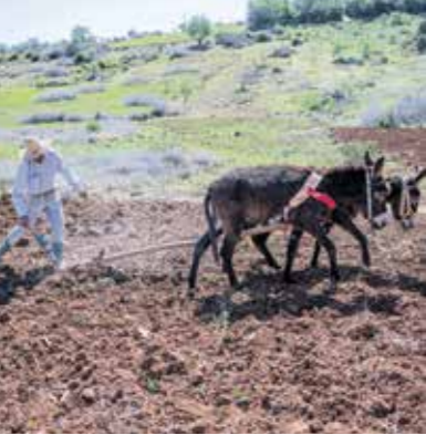
مزارع أحد حقول المغرب، مارس 2023

وأكد رئيس الجامعة المغربية للتأمين حسن بنصالح أن الهجاس الذي يسكن المهنين في قطاع التأمينات يتمثل في توسيع مجال التغطية لعدد أكبر من السكان، على اعتبار أن معدل المشمولين بالتأمين في المغرب يصل إلى أربعة في المائة، ما يعني أن هناك هوامش كبيرة للتطور، وأشار إلى أن الزلزال الذي ضرب البلاد في سبتمبر/ أيلول 2023، دفع إلى الانخراط أكثر في أنواع جديدة من التأمينات، خاصة المخاطر