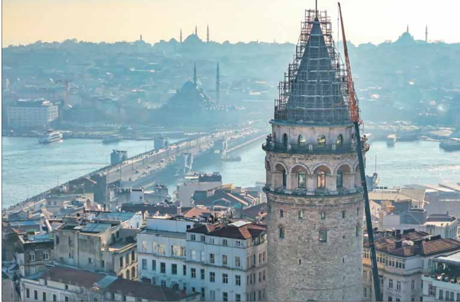
برج غلاطة قيد الترميم

فوجئ السياح، خاصة العرب منهم، بغياب برج غلاطة عن برنامج زيارة مدينة إسطنبول، رغم أنه يدرج عادة إلى جانب آيا صوفيا وجامع السلطان أحمد وقصر التوب كإيه، وهو مغلق للترميم