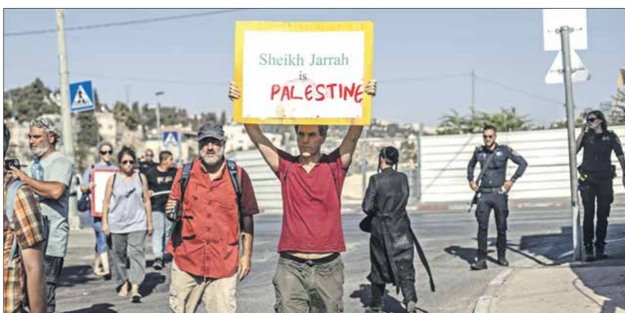
برض الاستيطان في حي الشيخ جراح