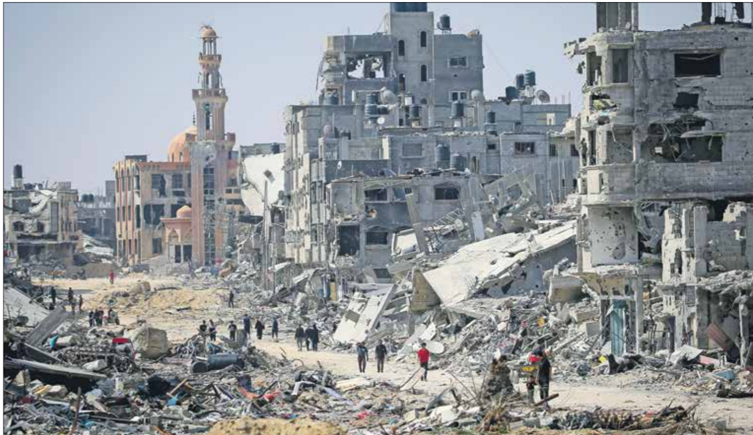
مجدد ملاحم لعمان واحياء