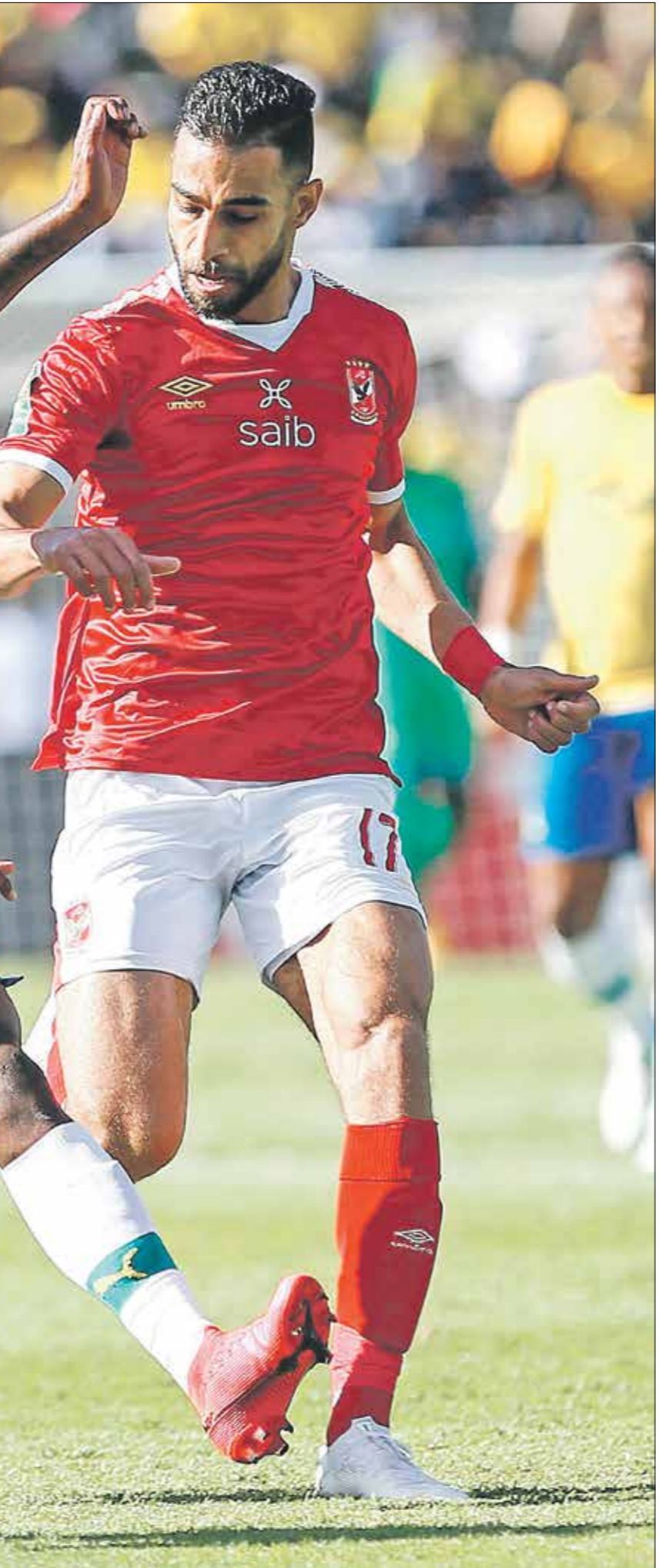
علم الاهلي بصورة المهمّة في نصف نهائي ابطال

نجح فريقا بايرن ميونخ وبوروسيا دورتموند في بلوغ دور نصف النهائي لبطولة دوري أبطال أوروبا لكرة القدم، خلال منافسات الموسم الكروي الجاري 2023-2024. وذلك بعد تحطيمها إرسال الإنكليزي وائلتسكو مدريد الإسباني على التوالي في الدور ربع النهائي من المنافسة، ليضرب الأول موعداً مع ريال مدريد الإسباني في المرحلة القادمة، فيما سيلاقى الثاني، بايريس سان جيرمان الإنكليزي وائلتسكو مدريد الإسباني على التوالي في الدور ربع النهائي من المنافسة، لكن أمّله في موسم 2012-2013، وذلك حينما استطاع الفريقان بلوغ الدور النهائي آنذاك، عقب تأهل النادي البافاري إلى حساب فريق برشلونة الإسباني في الدور نصف