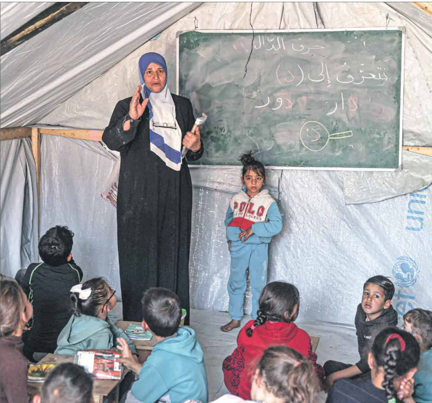
مبادرات للتعليم داخل خيام رفح

6296 عدد التلاميذ التقريبي الذين استشهدوا في قطاع غزة والضفة الغربية منذ بدء العدوان الإسرائيلي.