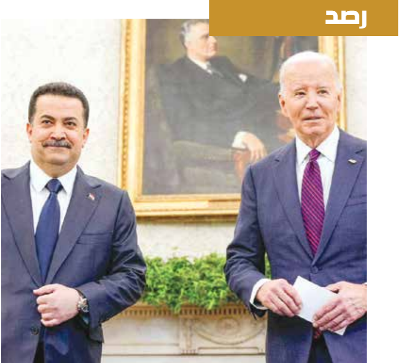
بائد والسوداني في البيت الأبيض، 15 إبريله الحالي