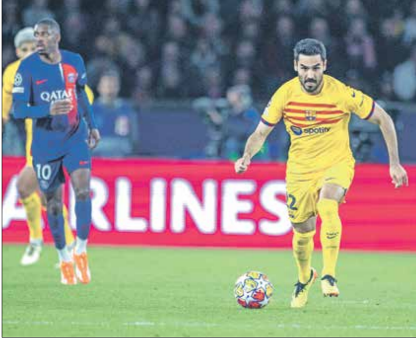
غوندوغان هاجم زميله في الهدف

وتشكل طرد المدافع اراوخو متحفظا في مشوار برشلونة في منافسة دوري أبطال أوروبا، إذ أنهى أحلامه وربما سيخرج النادي صفر الجيوب هذا الموسم بعد أن أحاط هجوم أراوخو ويتجه لخسارة اللقب المحلي لصالح ريال مدريد، الذي يتقدم في الدوري الإسباني بفارق ثماني نقاط كاملة قبل الكلاسيكو المقرر أن يلعب هذا الأحد بملعب سانتياغو برنابيو، وبالتالي فإن التصريحات الأخيرة قد توترت في تعامل الفريق مع المواجهة المرعبة والتي ستكون صعبة خاصة بعد أن فشل برشلونة في حصد نتائج إيجابية هذا الموسم أمام الأندية القوية في مختلف المسابقات. وسبق للتحف الالماني أن أثار أزمة أولى في النادي الكتالوني، عندما هاجم أداءه بفرقة عقب هزيمة الذهاب أمام ريال مدريد، معتبرا أن الفريق يفتقد إلى الشخصية المميزة وبالتالي كانت الهزيمة نتيجة عدم قدرة اللاعبين على التعامل مع الأوقات الصعبة في المباراة، ومن شأن التصريحات الجديدة، أن تعرض على إدارة برشلونة التدخل من أجل وضع حد للتصريحات المتيرة الصادرة عن اللاعب الألماني.