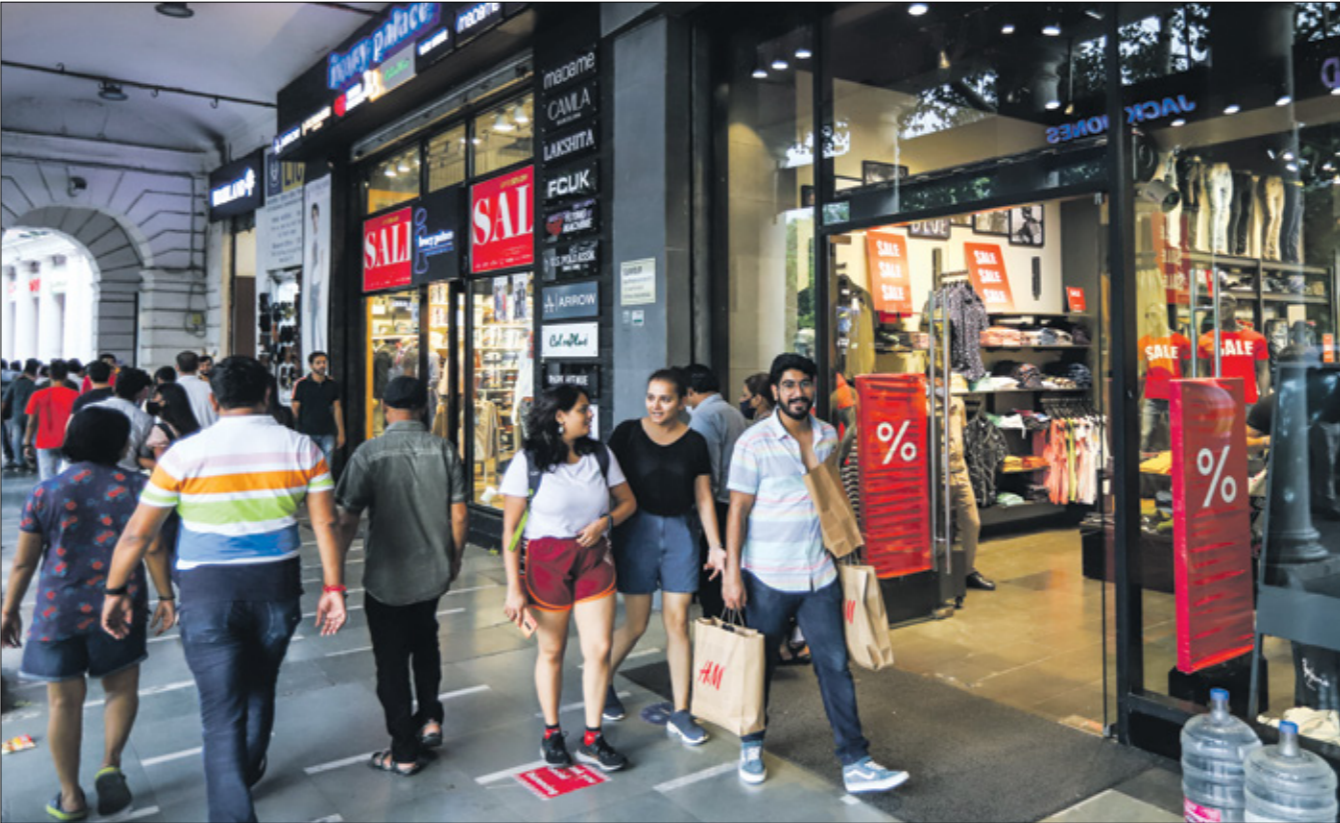
نيودلهي لتأسيس المواقم الغربية عملت والتجارة (المجربت كومر سونغ/سبغ/الآن)

نيودلهي تجري إصلاحا للسياسة النقدية والخدمات المالية