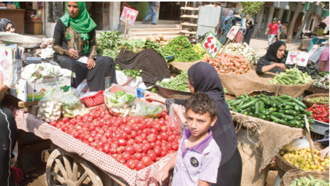
سوق طرطوا في أحد الأحياء الشعبية بالفااهرة، 12 مايو 2014

وشكل وزير التموين، على المصالح، لجنة عليا للمخابز السياحية، تجتمع مرة على الأقل شهرياً، تتولى بالاشتراك مع شعبة المخازن بالغرف التجارية، الإشراف على خفض أسعار الخبز والدقيق بالأسواق، وإعادة النظر في تكلفة البيع للمستهلك كل 3 أشهر، وتقييم أوضاع المخازن غير المرخصة وبعفي التضخم أسعار السلع الأساسية عند مستوياتها المرتفعة، رغم وهولها من مستوى 40% على أساس سنوي منتصف عام 2023، إلى نحو 33% في مارس/ آذار من العام الجاري، حيث تبرز توفعات باستمرار ارتفاعها خلال الفترة المقبلة، متأثرة بتراجع قيمة الجنيه أمام الدولار رسمياً، مع عدم خفض أسعار السلع المستوردة، واتجاه بعضيا إلى الإفراج في الأسواق الدولية، كالتحجج والدقيق (الصحين) واللحوم، متأثرة باستمرار حالة الاضطراب في سلاسل الإمداد والحرب الإسرائيلية المستمرة على قطاع غزة.