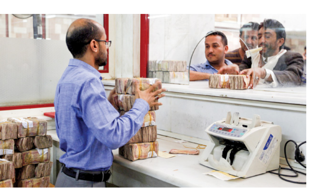
عملاء يسحبون نقودا من البنك المركزي في صنعاء، 25 أغسطس 2016