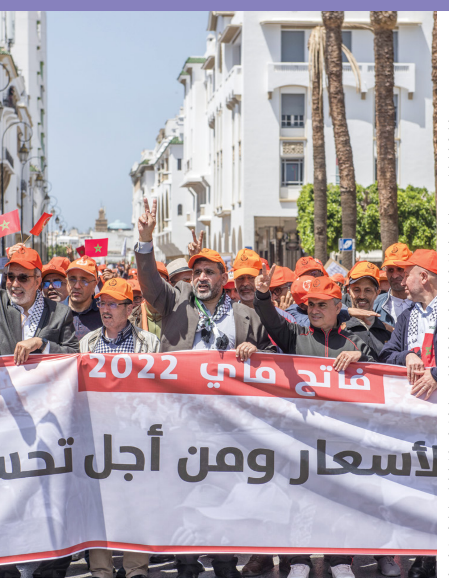
تظاهرة عمالية في الرباط للمطالبة بتخصي الاجور ، 12 مايو 2022